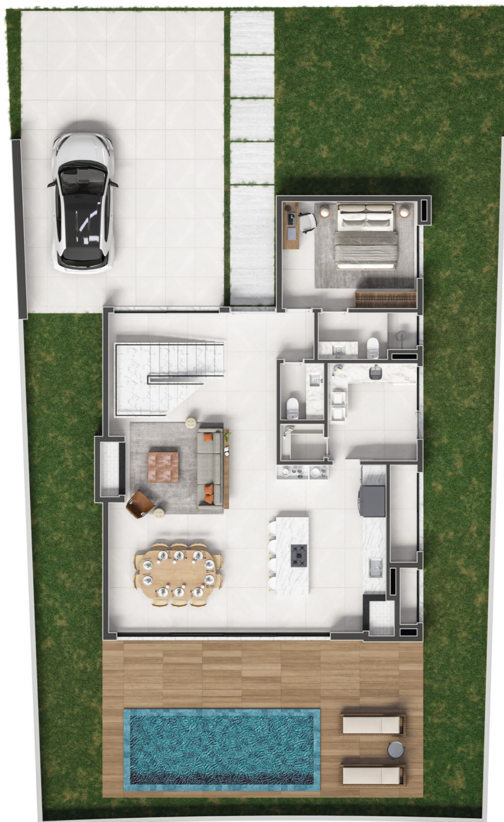
PLANTA BAIXA TÉRREO