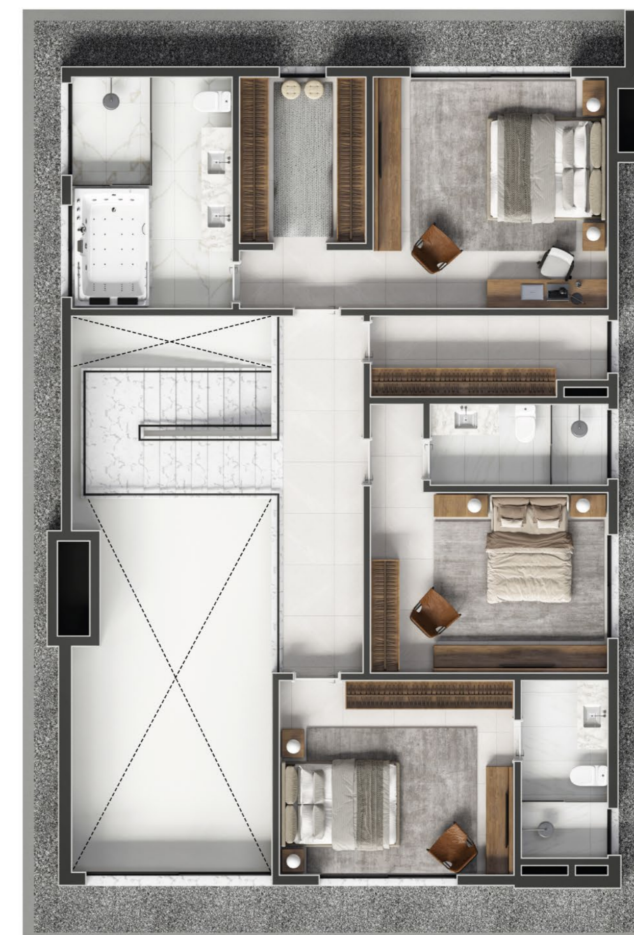
PLANTA PISO SUPERIOR