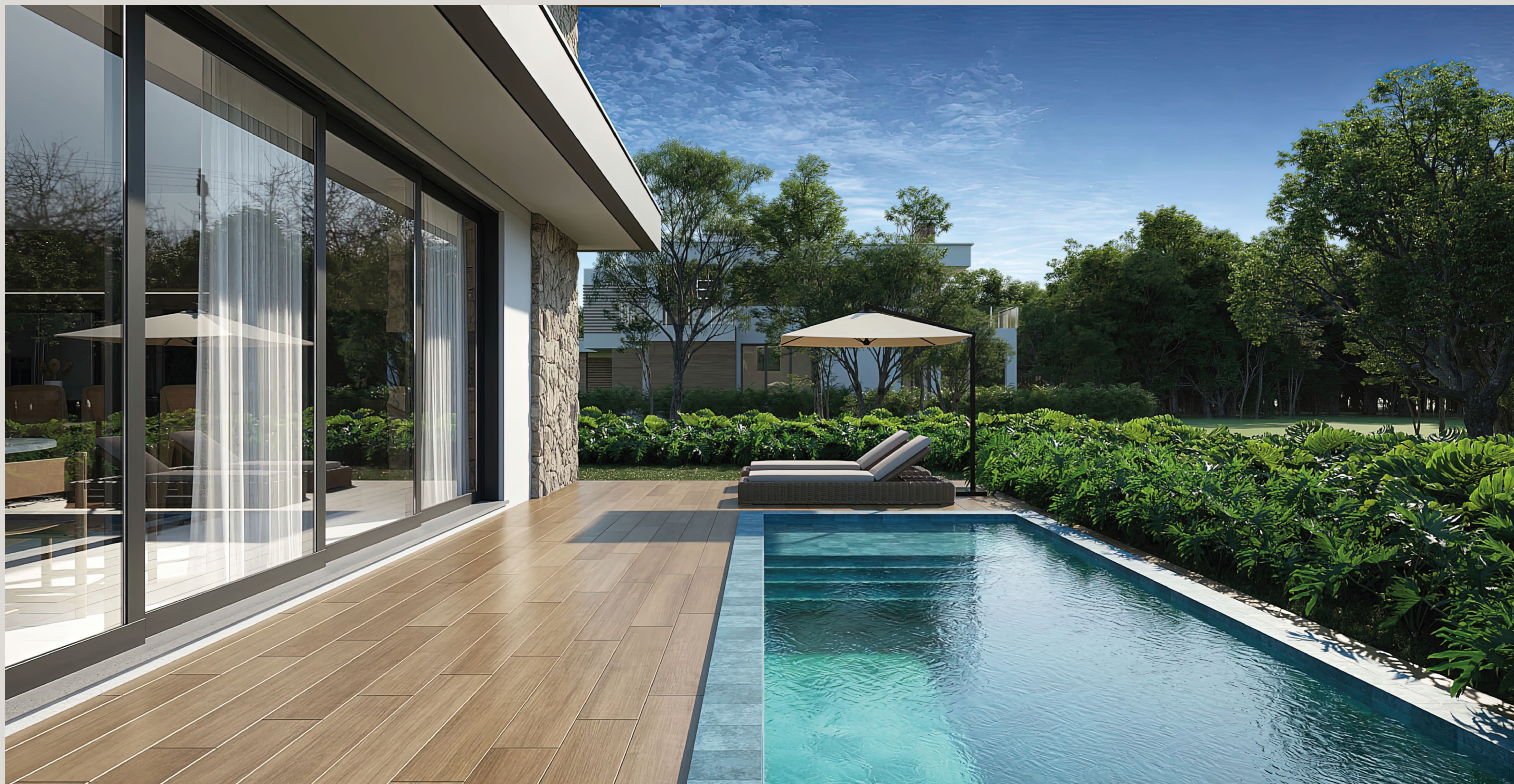
CASA AMARE . Quadra 15 . Lote 07 . Estilo Contemporânea