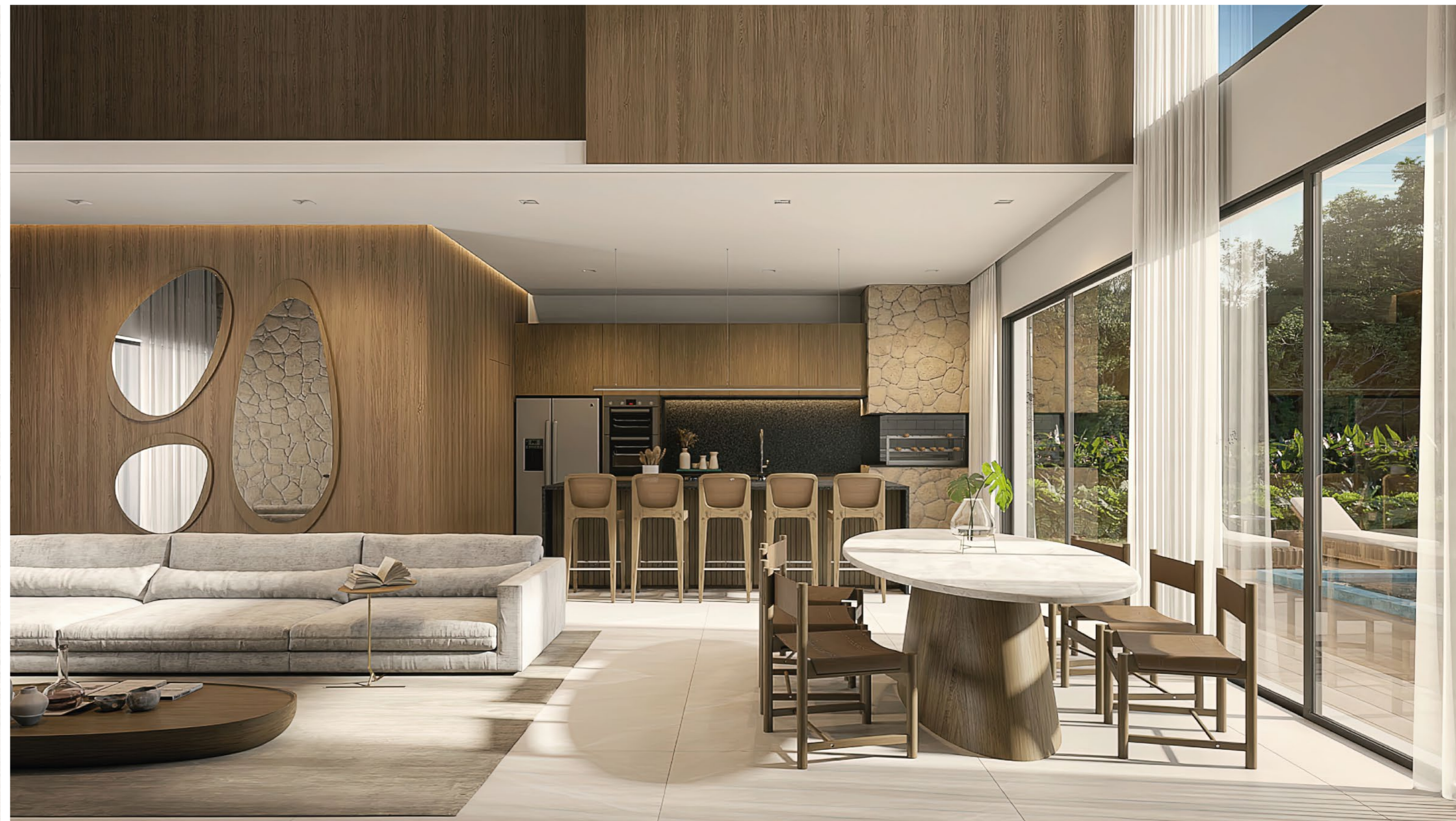
CASA AMARE . Quadra 15 . Lote 07 . Estilo Contemporânea