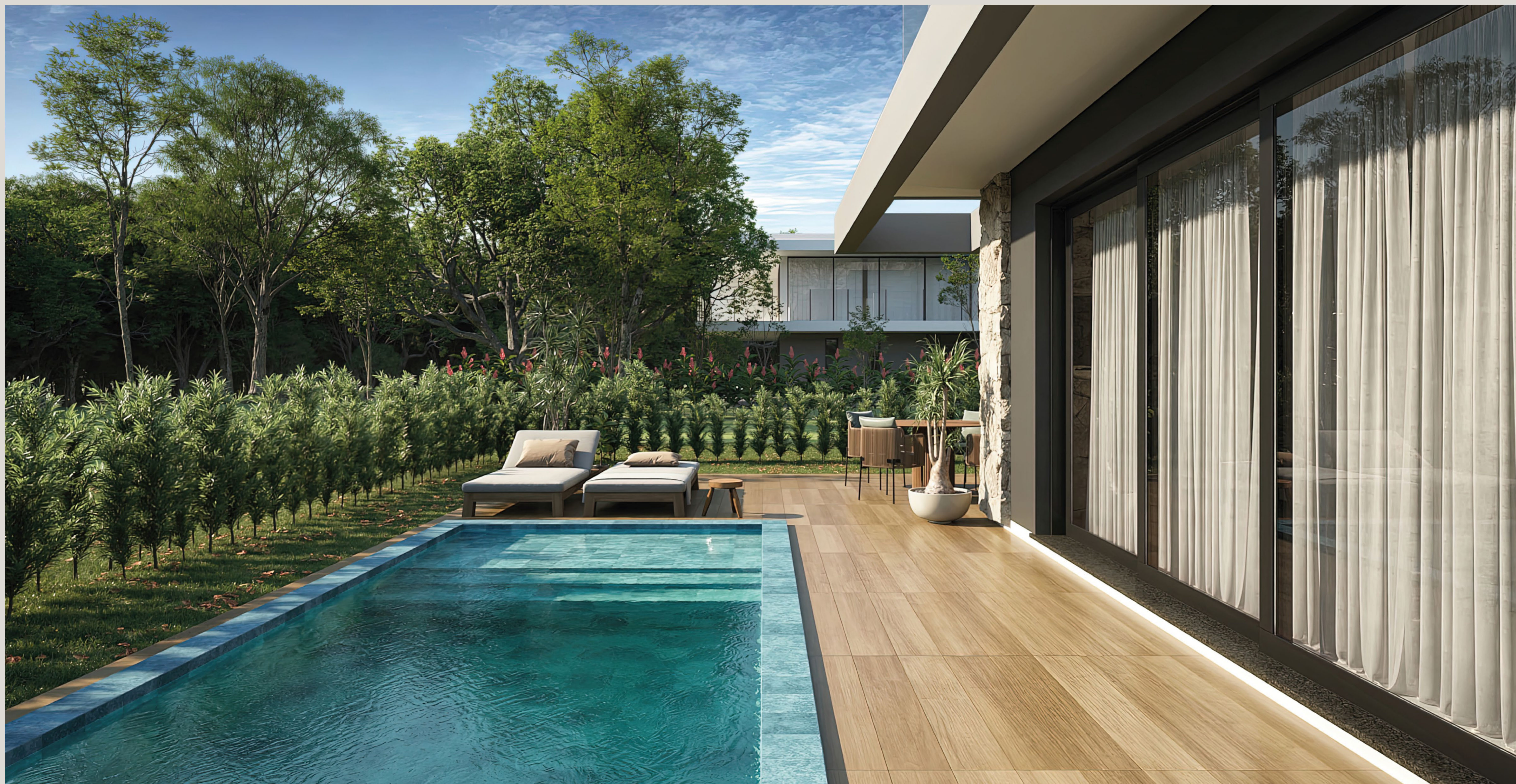
CASA FIGUEIRAS . Quadra 17 . Lote 20 . Estilo Contemporânea