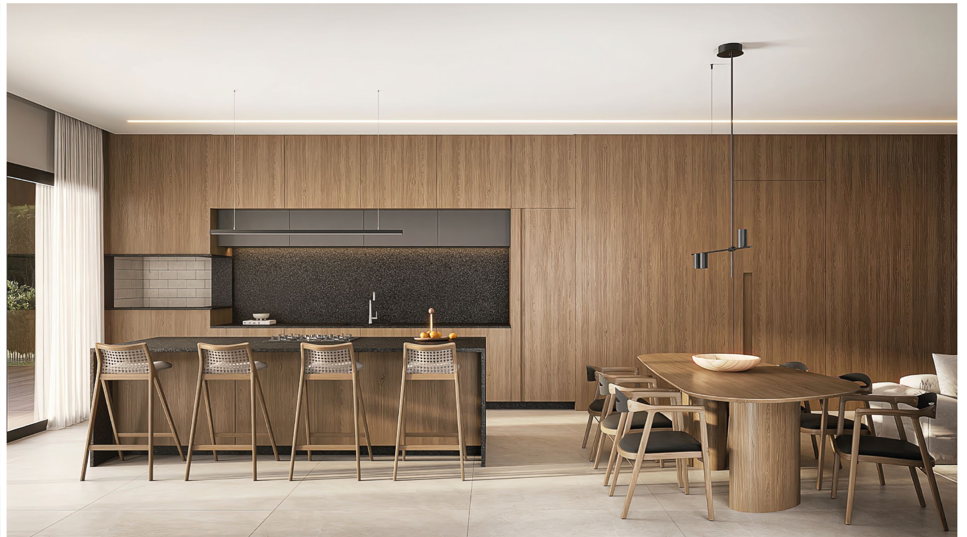
CASA FIGUEIRAS . Quadra 17 . Lote 20 . Estilo Contemporânea