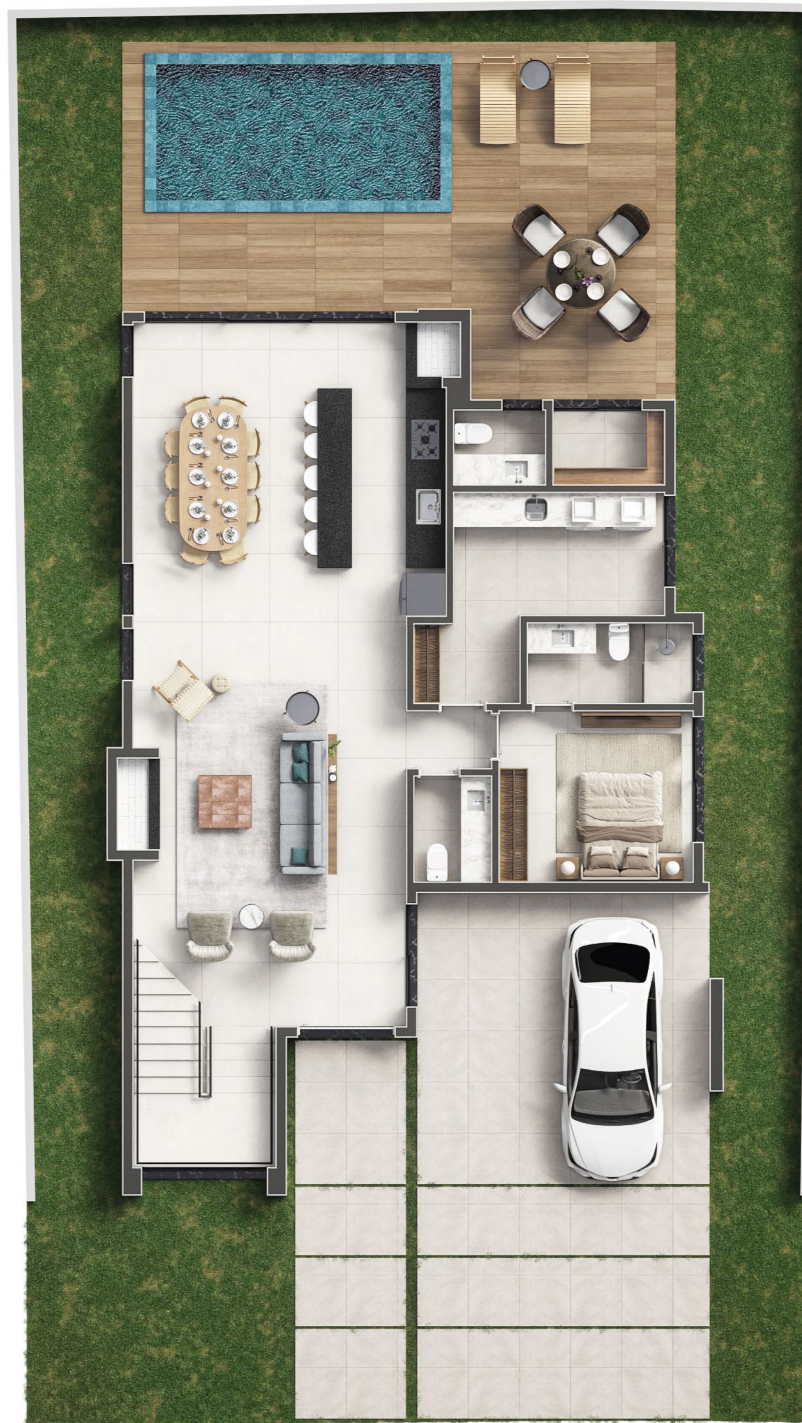
PLANTA BAIXA TÉRREO