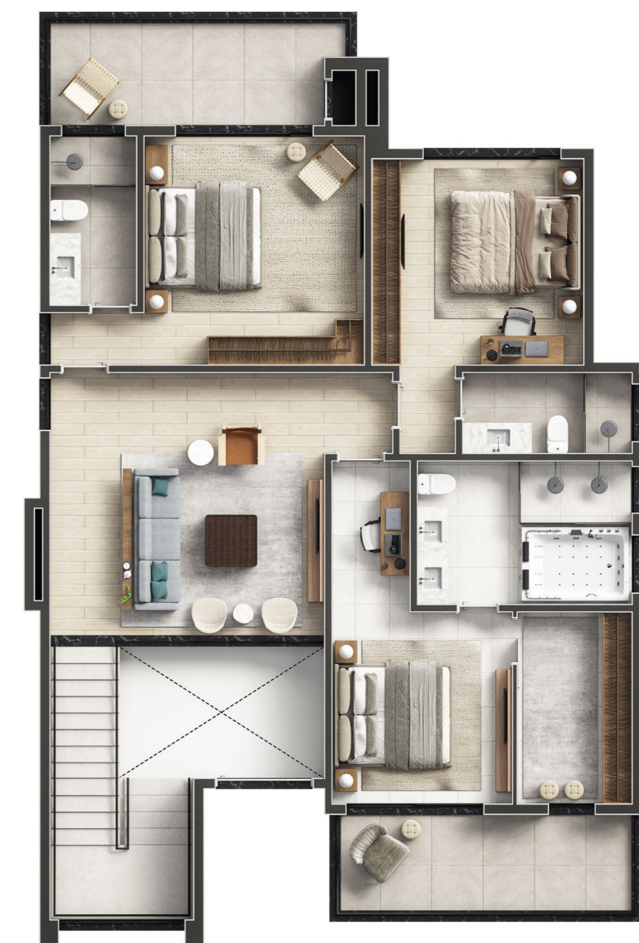
PLANTA PISO SUPERIOR