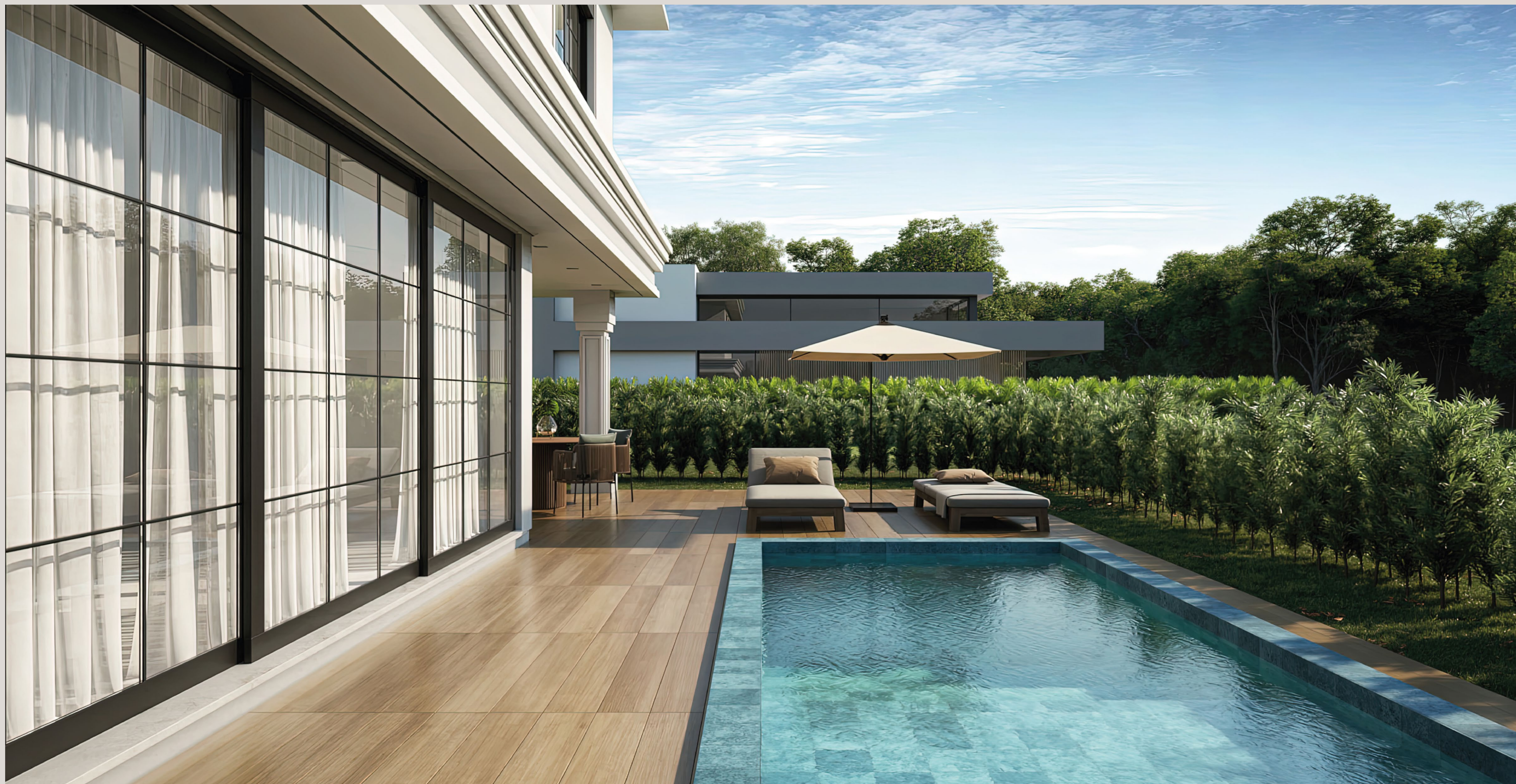
CASA IMPERIAL . Quadra 15 . Lote 06 . Estilo Neoclássico Contemporâneo