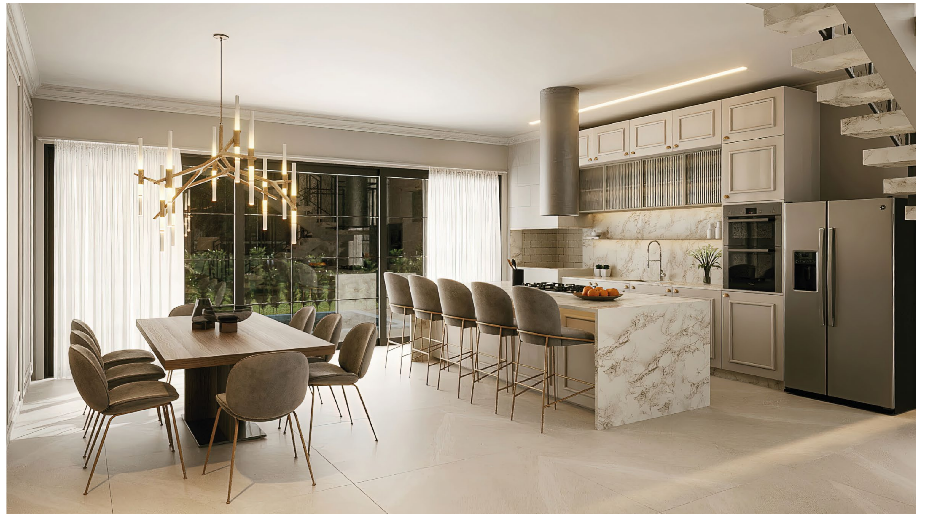
CASA IMPERIAL . Quadra 15 . Lote 06 . Estilo Neoclássico Contemporâneo