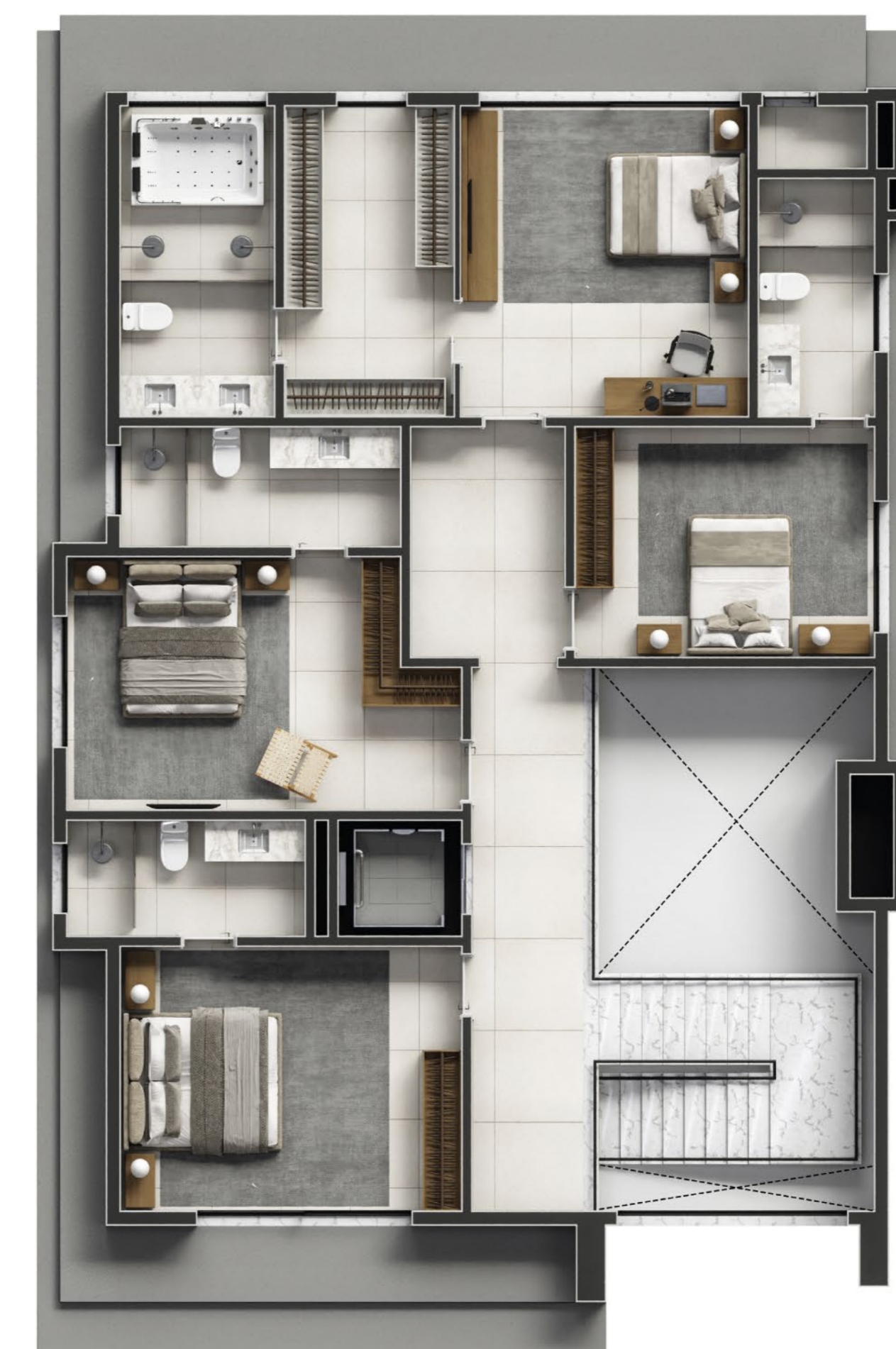
PLANTA PISO SUPERIOR