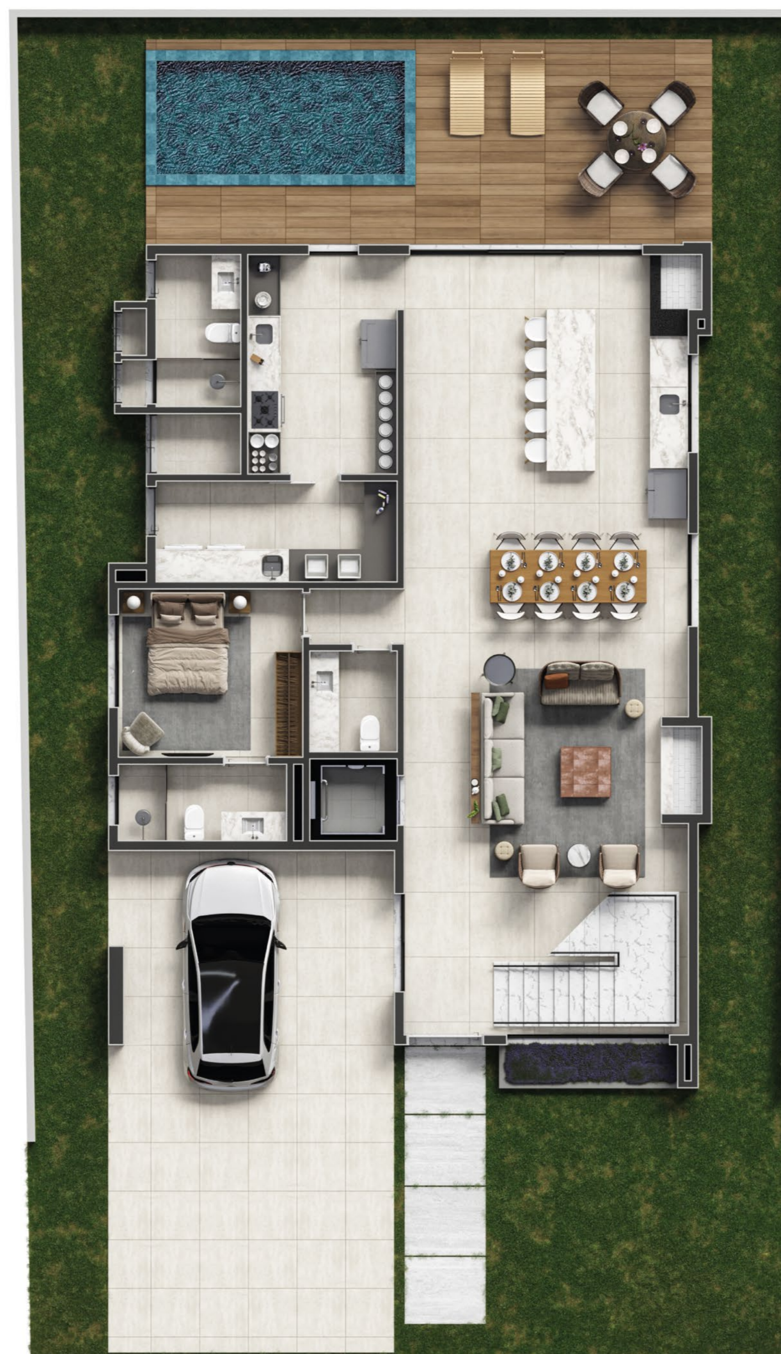
PLANTA BAIXA TÉRREO