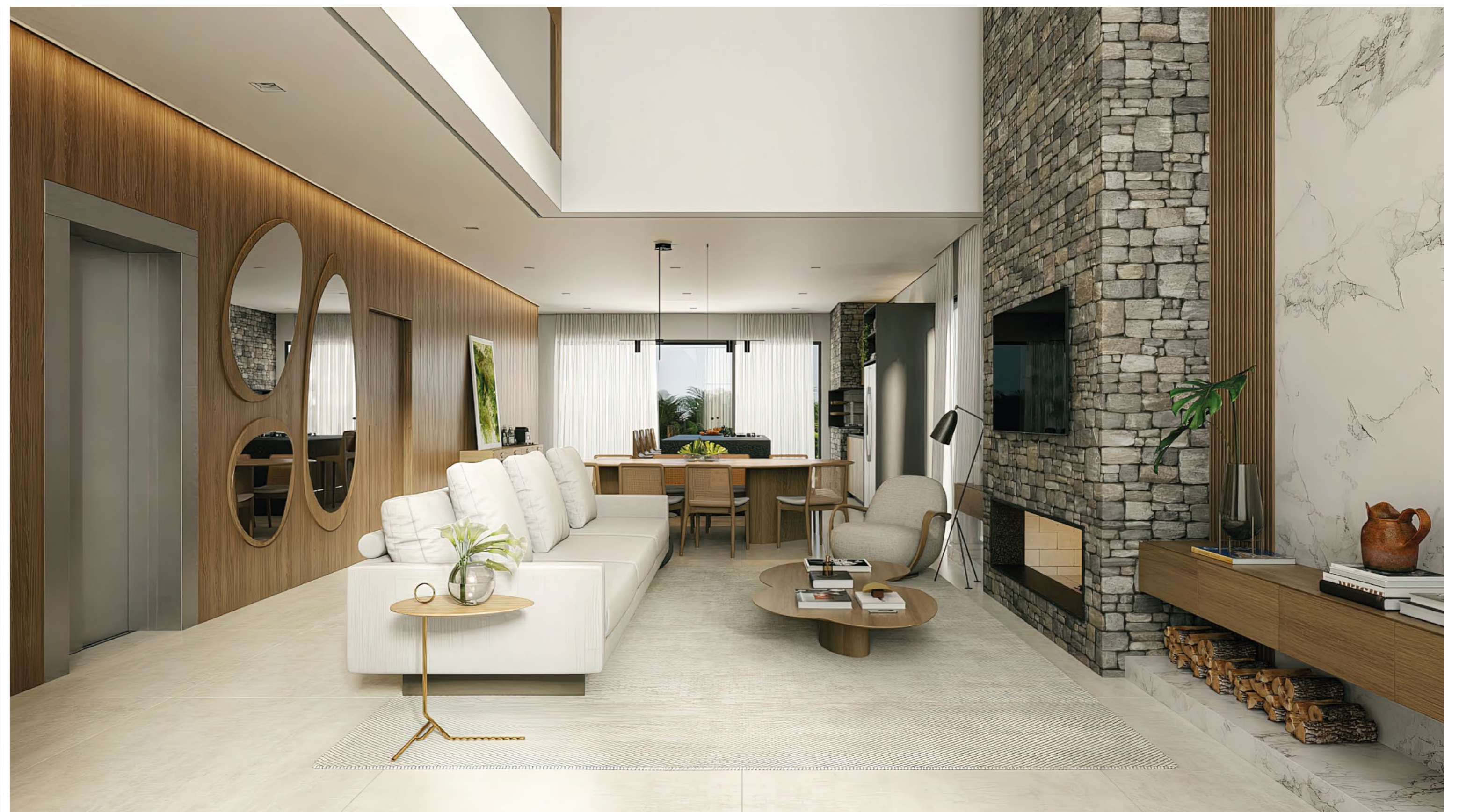
CASA VIVA . Quadra 07 . Lote 09 . Estilo Contemporânea