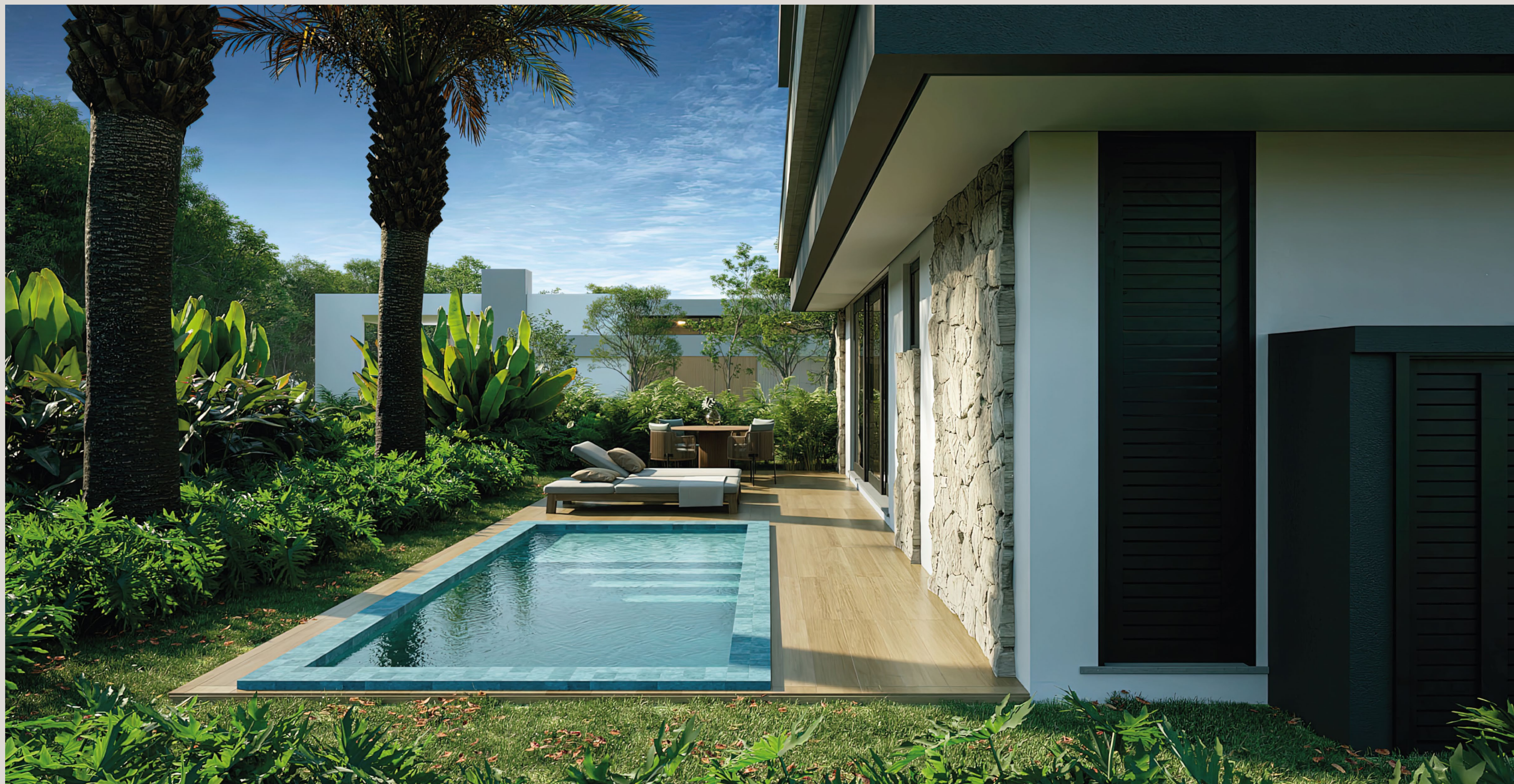
CASA VIVA . Quadra 07 . Lote 09 . Estilo Contemporânea