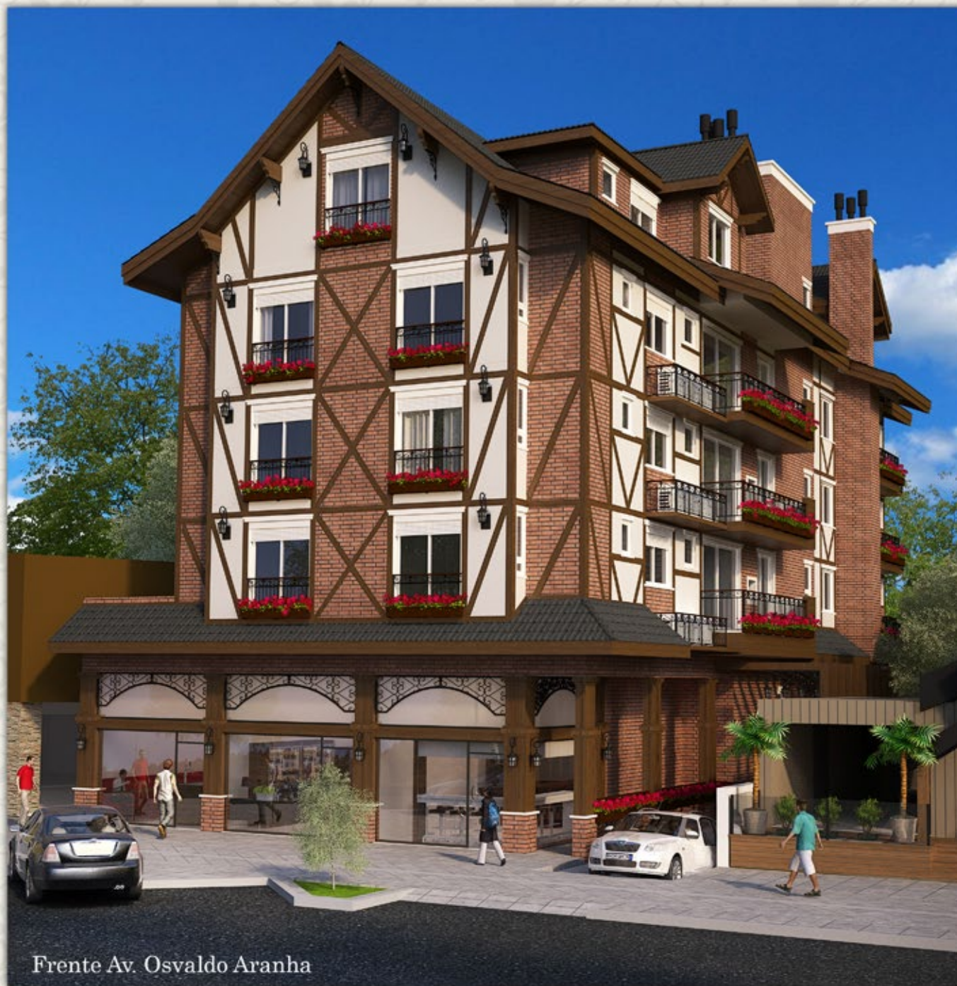
Frente Av. Osvaldo Aranha