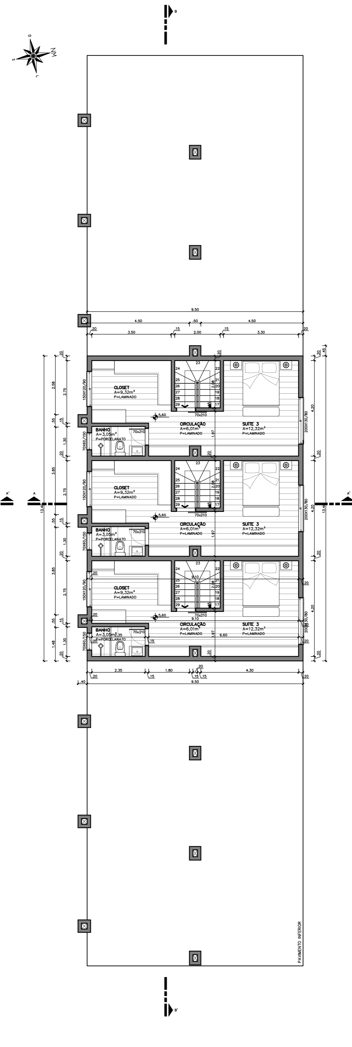
PLANTA BAIXA SUBTELHADO Área Total Construída=127,30m 2 Área Total Computável=114,82m 2 ESC.: 1:75