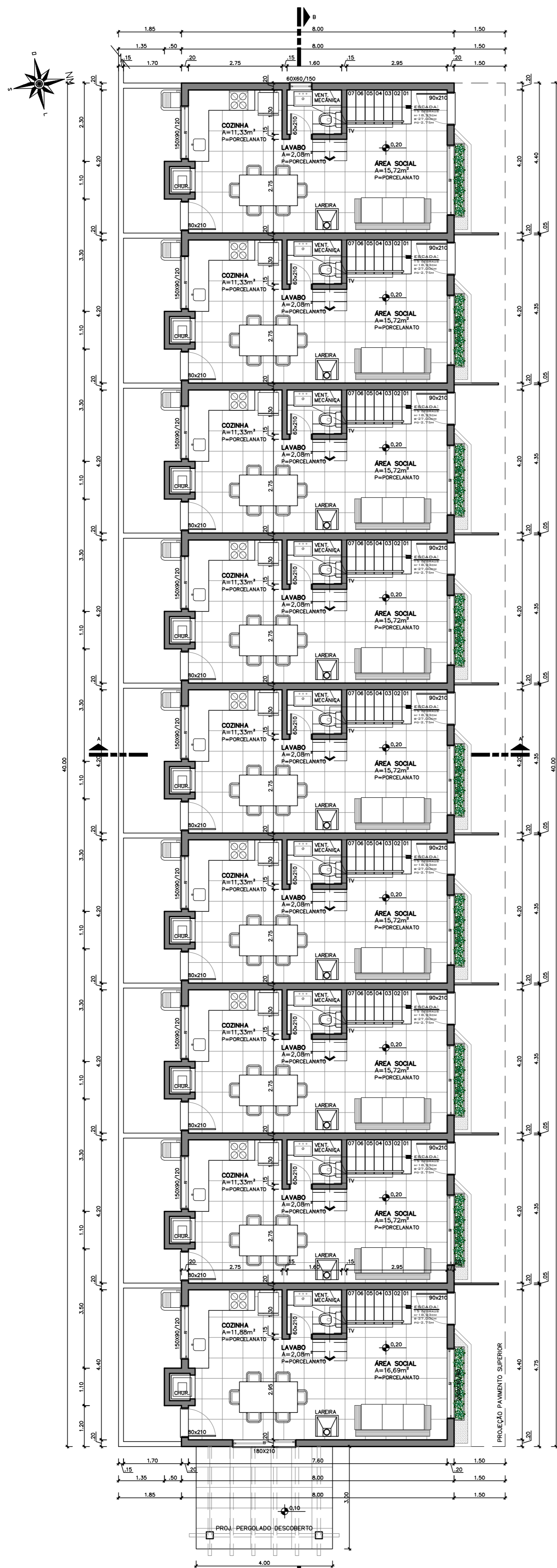
PLANTA BAIXA TÉRREO Área Total Construída=324,95m 2 Área Total Computável=324,95m 2 Área Total Vagas Estacionamento=112,50m 2 ESC.: 1:75