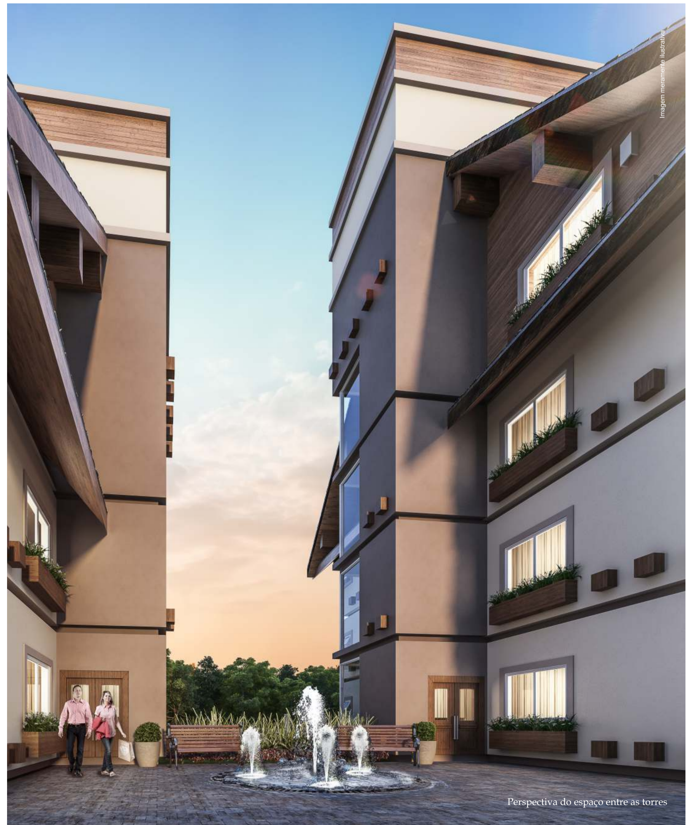
Perspectiva do espaço entre as torres