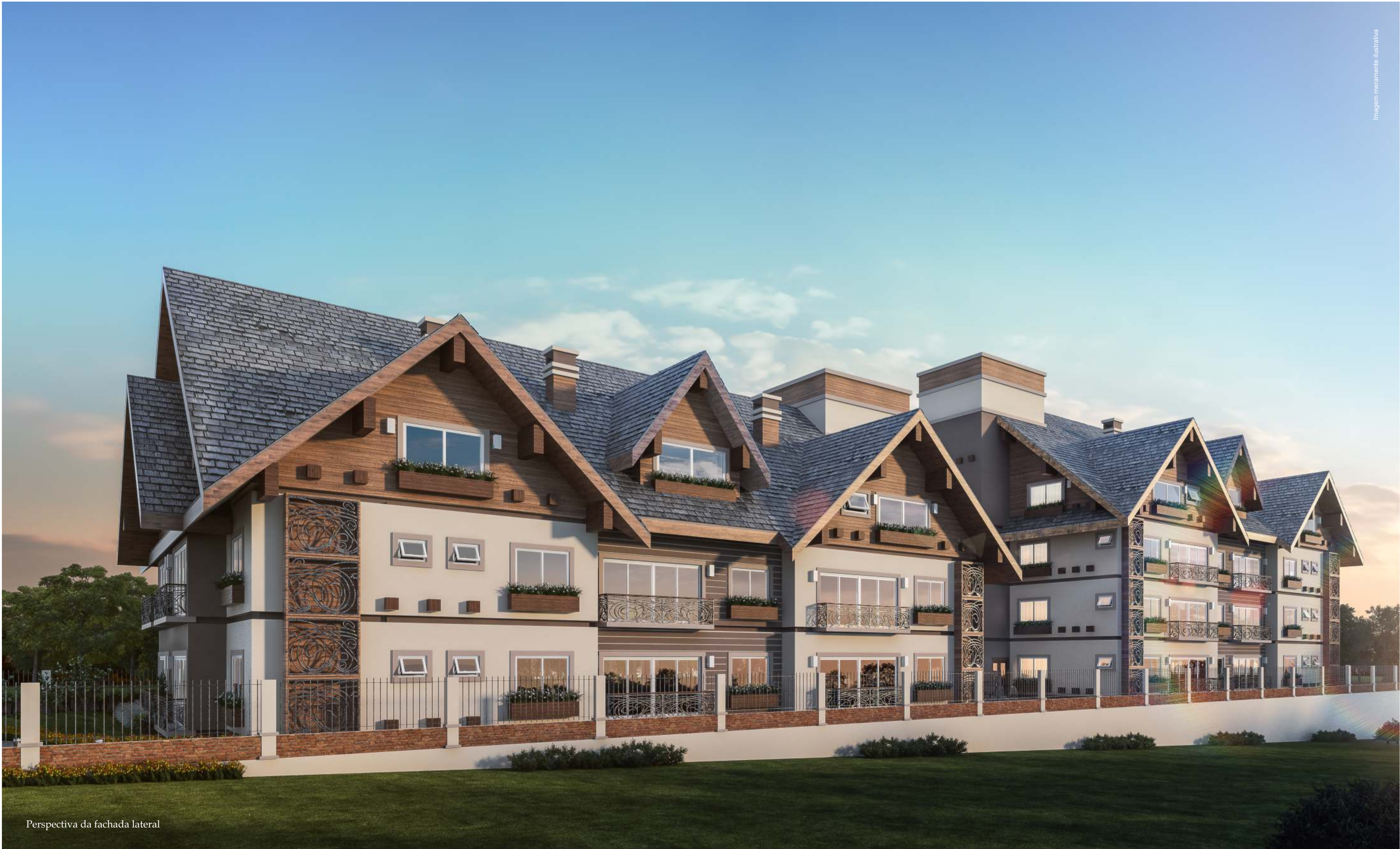
Perspectiva da fachada lateral