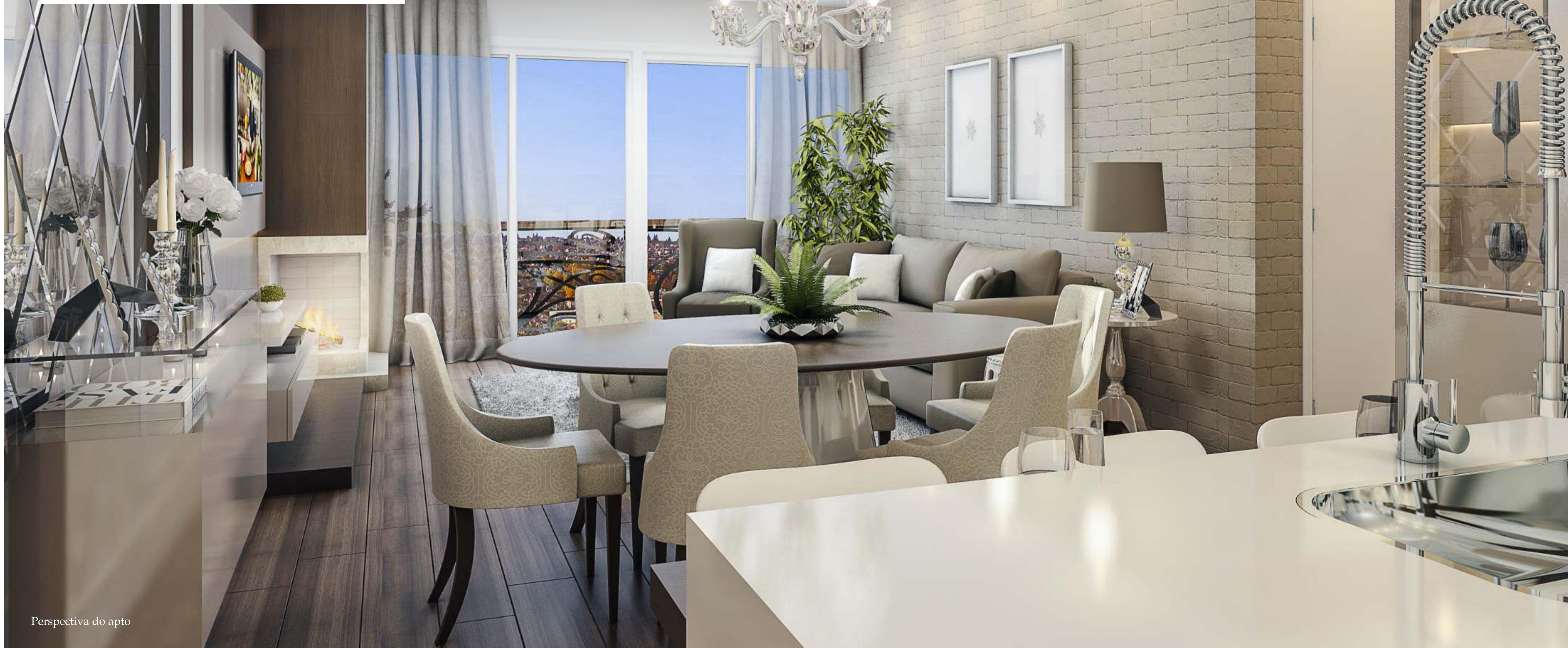
Perspectiva do apto

Um produto Hasam Móveis, qualidade já comprovada!