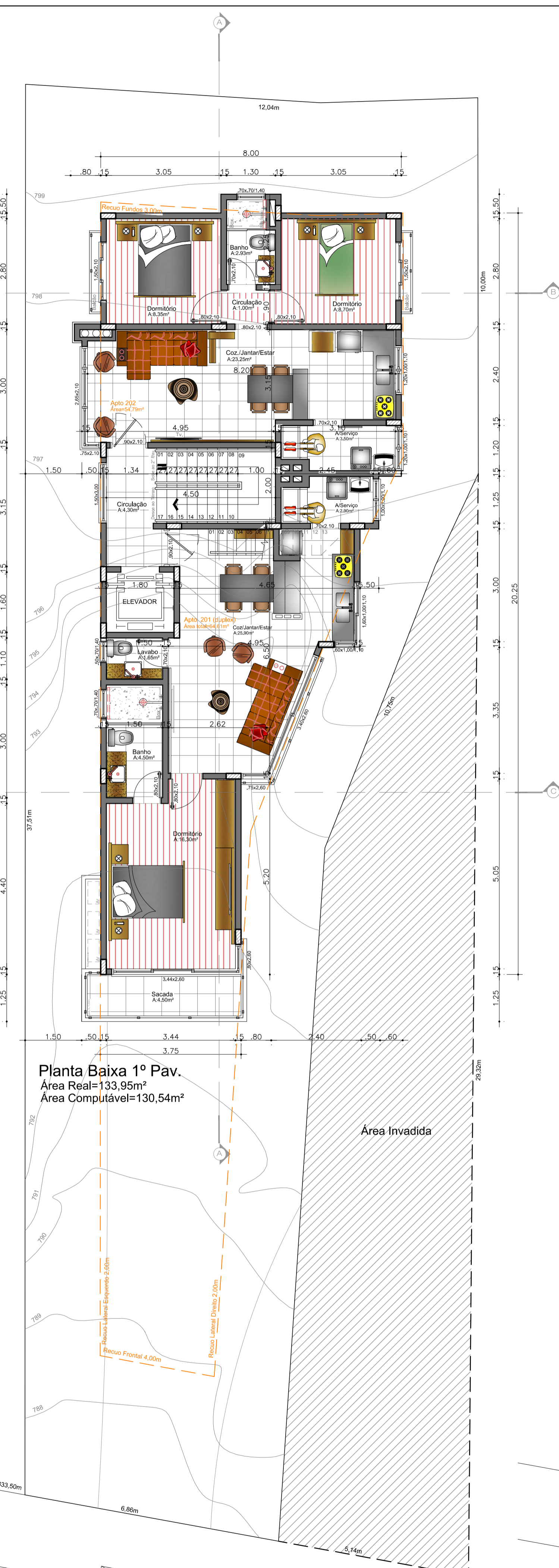
Planta Baixa 1º Pav. Área Real=133,95m² Área Computável=130,54m²