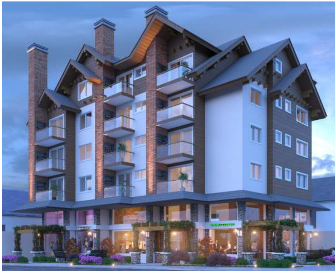
Perspectiva noturna do empreendimento