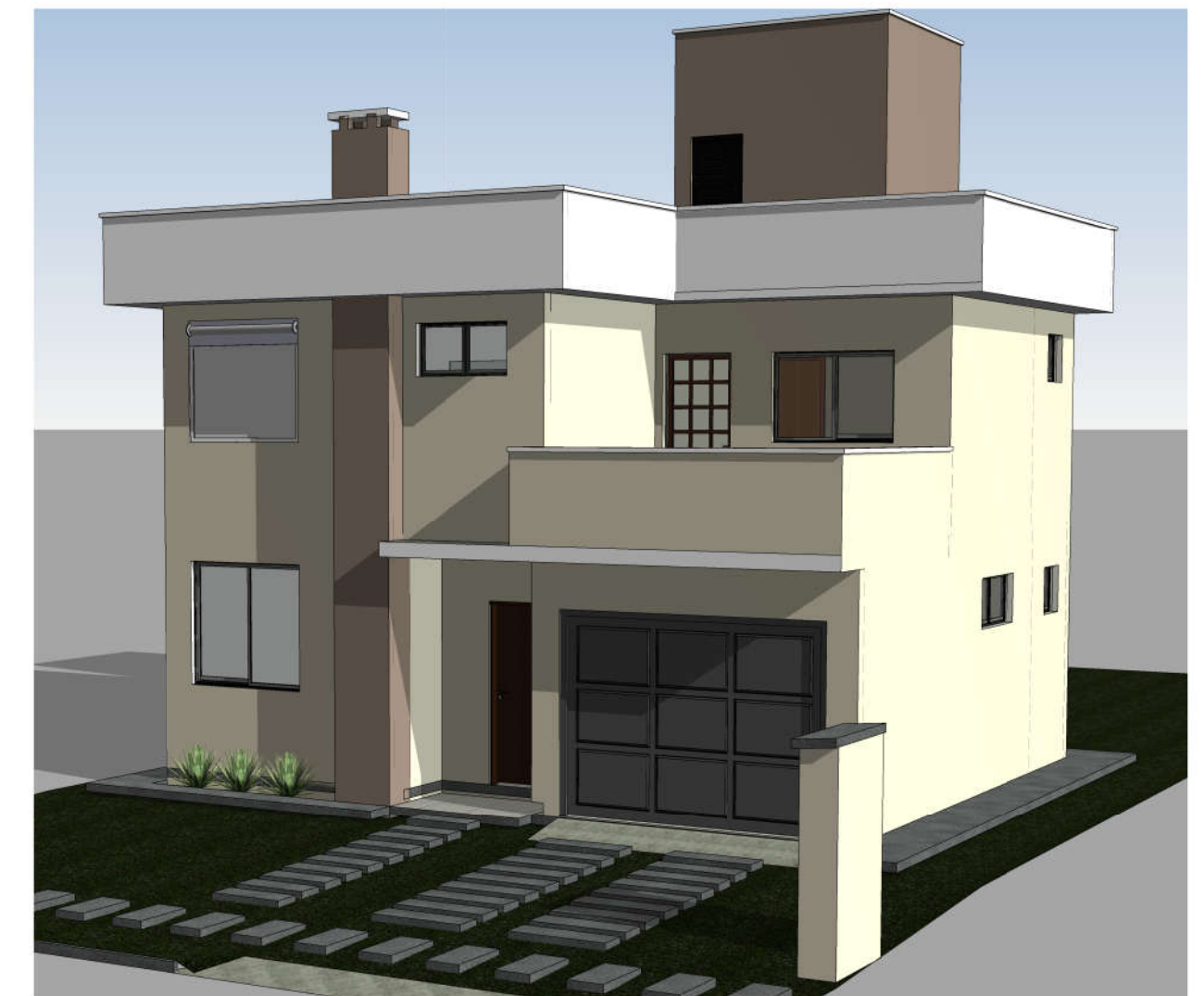
5 Vista 3D 1 ESCALA