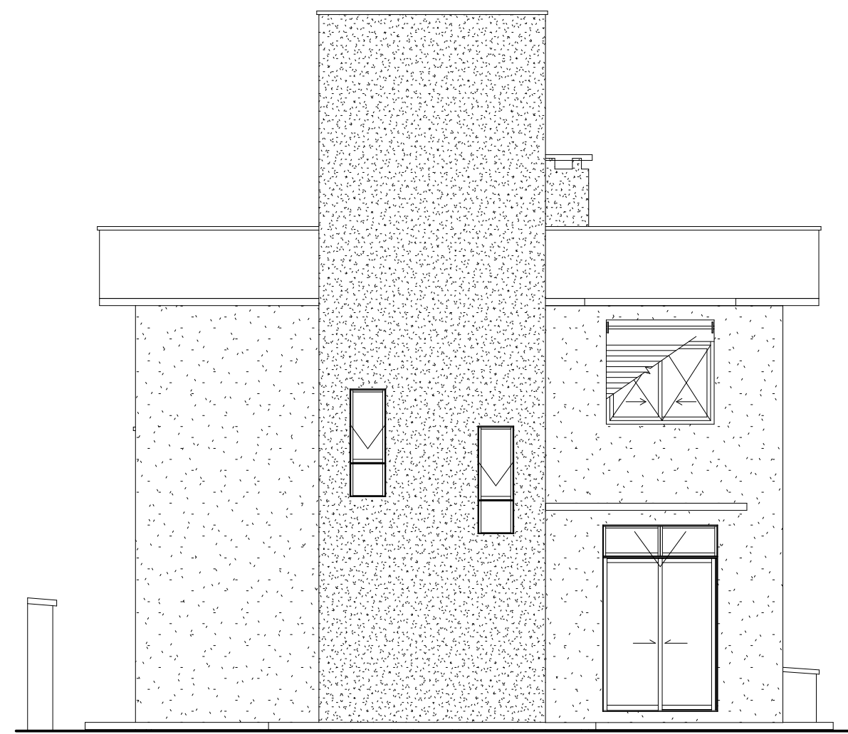
2 FACHADA SUL ESCALA 1:75