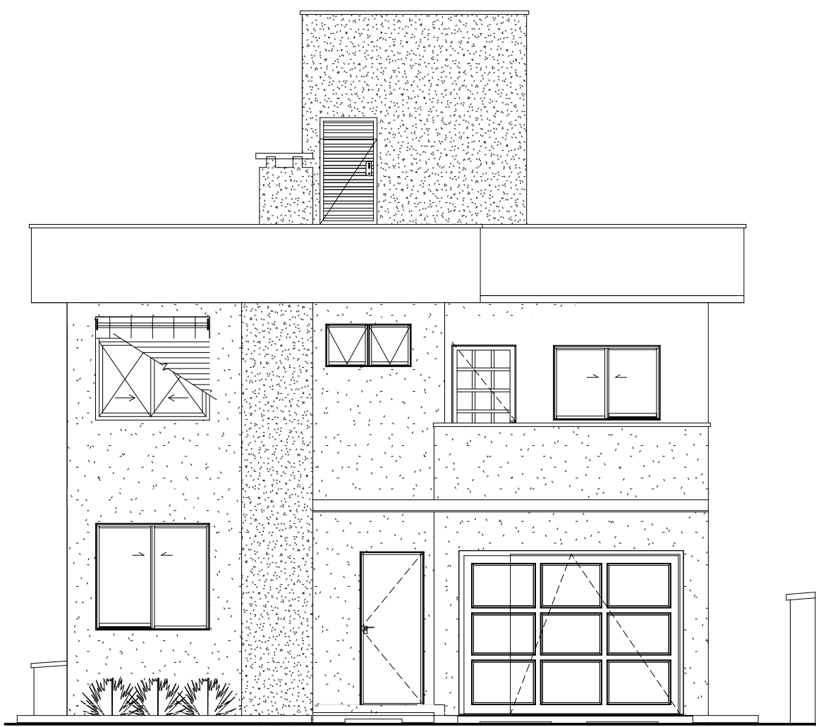
1 FACHADA NORTE ESCALA 1:75