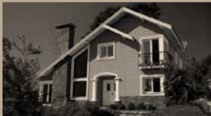
CONDOMÍNIO BUENA VISTA