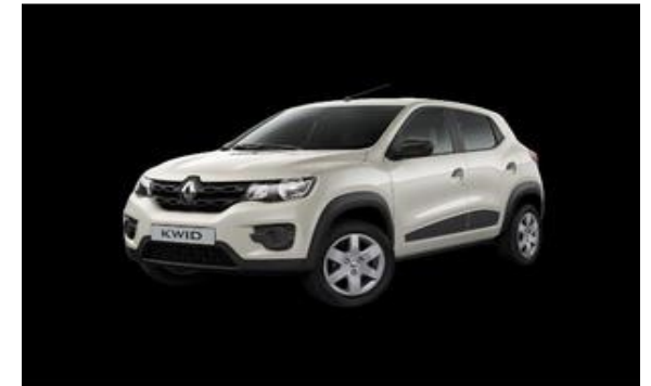
PALUDO INCORPORAÇÕES LTDA.