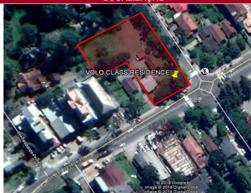
Av. das Hortênsias esquina com Rua Antonio Accorsi - Bairro Planalto - Gramado - RS