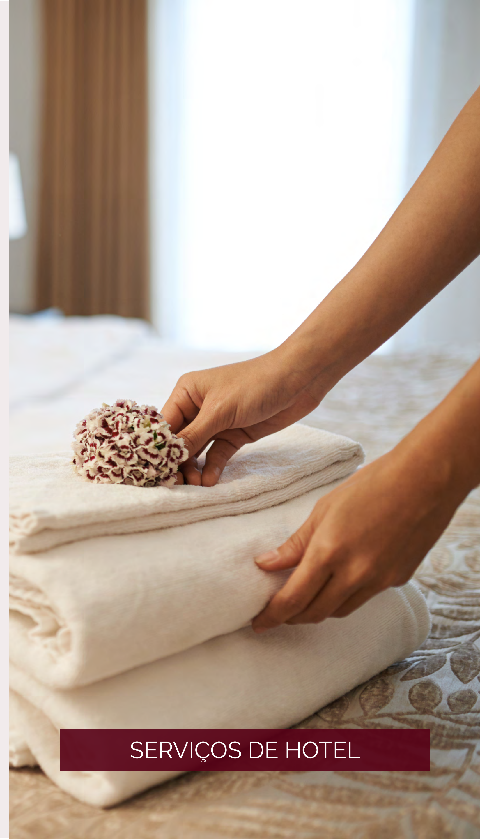
SERVIÇOS DE HOTEL