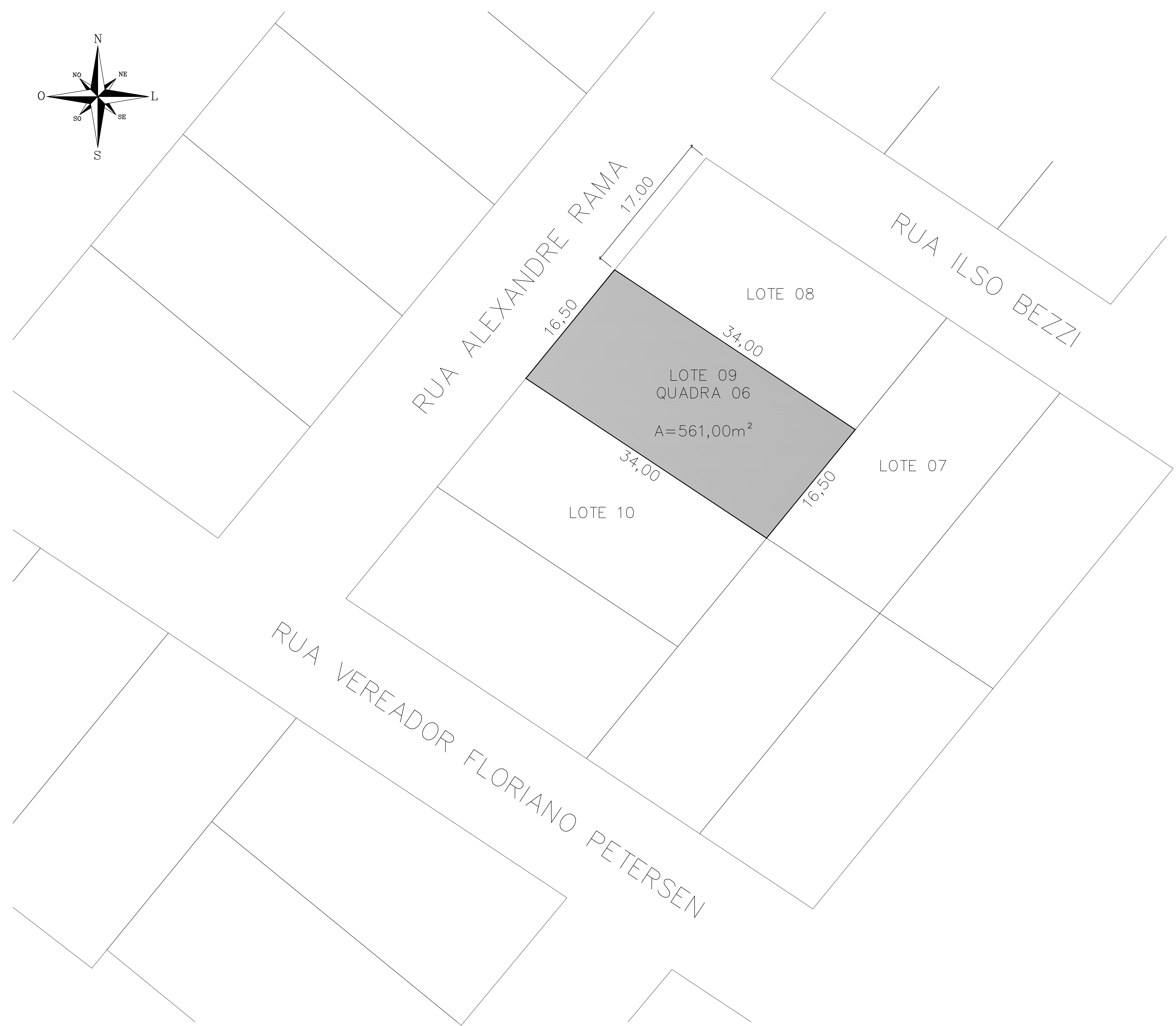
PLANTA DE SITUAÇÃO ESC.: 1/500